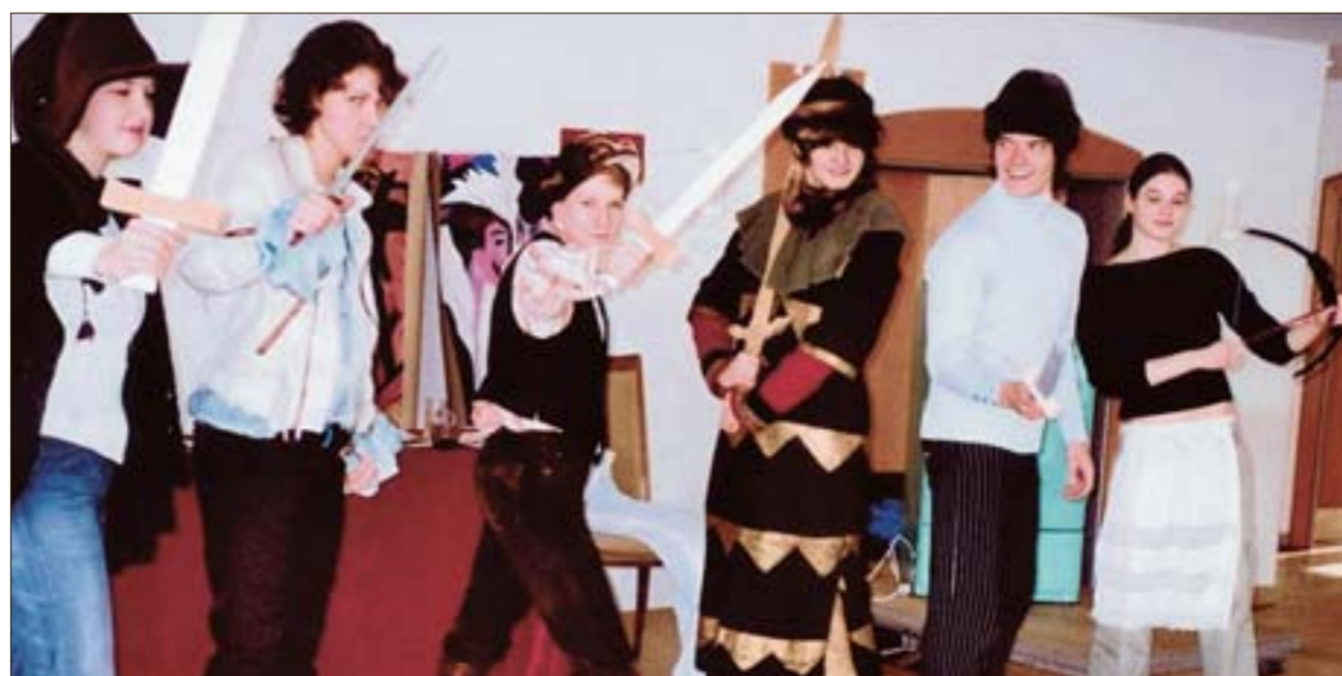
gibt es nie ein langes Gemetzel – Tod und Mord überraschen die Helden, die eben noch der Meinung waren, Herr des Geschehens zu sein!