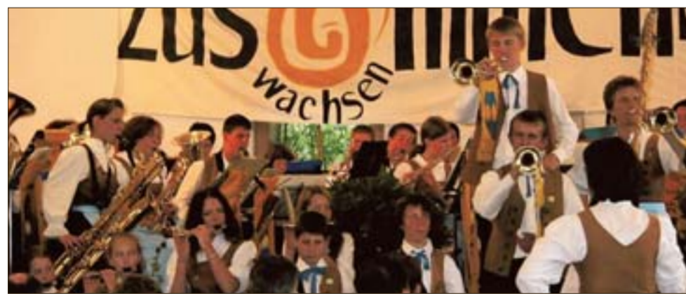
80 Musiker treten am Freitag, 18. März, in Hohenwart auf. Die Einnahmen des Konzertes werden Menschen mit Behinderung gespendet.

Info Die Musiker sowie die Verantwortlichen freuen sich auf die Gäste. Weitere Informationen zu dem Benefizkonzert unter Telefon (084 43) 85-106 (Helmut Hirner).