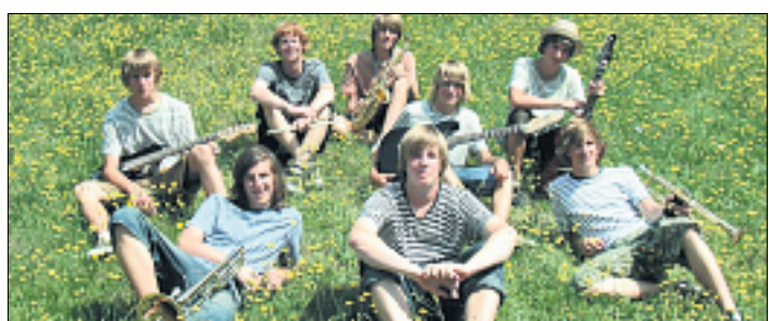
Lokalmatador: The Instant Vibes kommen aus Aichach.