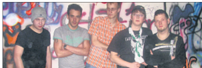
R.A.F., Richtig Aber Falsch“ kommt aus dem Raum Altomünster.