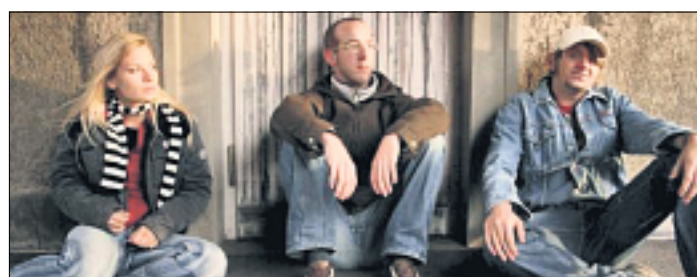
Die Band Leerlauf aus Mering.

Nichts mit der Terrorgruppe hat die Band R.A.F zu tun. Richtig Aber Falsch ist der komplette Name der Band aus dem Altomünsterer Raum. Seit Januar 2006 ist die Band in der aktuellen Besetzung unterwegs, und spielt inzwischen nicht nur auf Feiern und Geburtstagen, sondern durchaus auch vor größerem Publikum. Ausschließlich eigene Nummern stehen auf dem Programm der Punkrock-