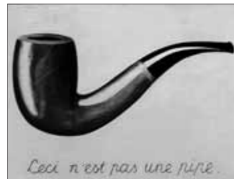
René Magrittes „Ceci n'est pas une pipe“.

● Die „International Exhibition of Modern Art“ ist noch bis zum 26. Juni im Kreisgut in Aichach (Am Plattenberg 12) zu sehen. Öffnungszeiten: Mittwoch von 17 bis 19 Uhr, Samstag und Sonntag von 14 bis 17 Uhr.