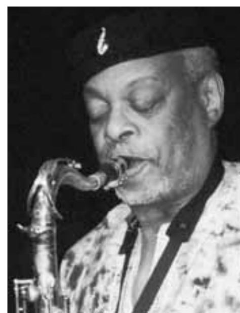
Ein Stargast: Dewey Redman.

@ Im Internet: www.kulturbuero.augsburg.de