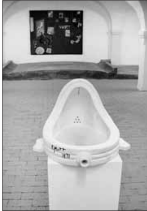
Kunstgeschichte in Kopien: Duchamps „Urinoir“ vor einem Matisse, daneben dessen berühmter Tanz, zu sehen in Aichach.